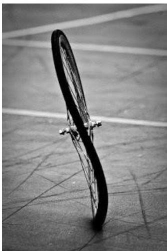
Рис. Восьмерка на колесе велосипеда.