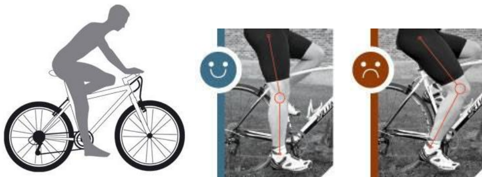
Рис. Правильная высота седла: при доведении педали до нижней точки нога велосипедиста выпрямляется.

Подсчитываются баллы за второй этап игры.