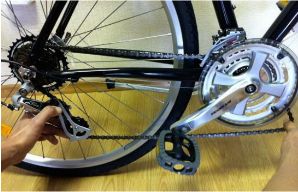
Рис. Проверка свободного хода цепи: 1 этап – зажать отрезок цепи; 2 этап – изогнуть отрезок поперек.

4. Проверка свободного хода цепи. Для этого двумя руками зажать отрезок цепи длиной примерно 15 см и постараться изогнуть его поперек. Если цепь сильно изгибается — это показатель того, что она изношена и ее необходимо заменить;