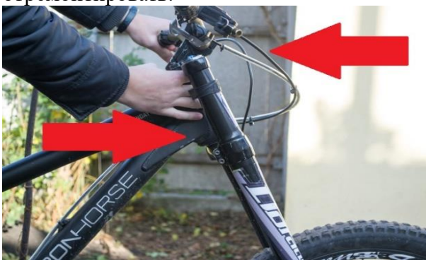
Рис. Проверка рулевой колонки на наличие люфта.

2. Проверка рулевой колонки. Зафиксировать переднее колесо тормозом, покачать велосипед на колесах вперед-назад, держать ладонь на стыке чашки и крышки рулевой колонки. В таком положении проверить на наличие люфта в рулевой колонке (о люфте обычно говорят, когда руль болтается, скрипит или туго поворачивается). Затем, поворачивая руль влево и вправо, необходимо проверить затяжку рулевой колонки. Если повороты невозможны, это указывает на перетянутость рулевой колонки. Ее необходимо отремонтировать.