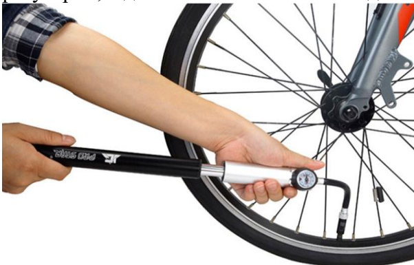
Рис. Подкачивание велосипедных покрышек насосом

3. Проверка давления в шинах. Нажать пальцами на покрышки. Низкое давление приведет к плохой управляемости велосипеда и износу шин. Подкачивать их нужно регулярно, а для этого желательно всегда возить с собой насос.