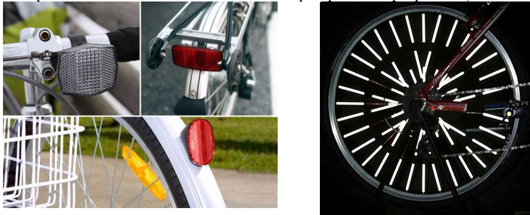
Рис. Проверка фонарей, фар и световозвращающих элементов.

оранжевые – желательно устанавливать на боковых сторонах велосипеда (именно такое расположение позволит вас заметить при проезде перекрестков).